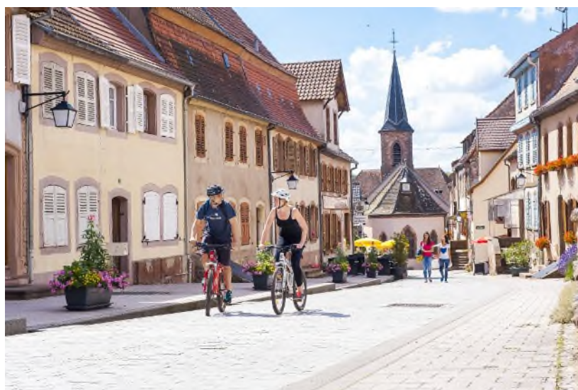
Le "Staedtel" de La Petite Pierre